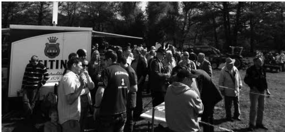
Die Schützen und Zuschauer

7 Mannschaften, 27 Schützen, 1 Schützin, ~ 700 Schuss aus den Luftgewehren, ca. 650 abgeschossene Gipssternchen, 7 Schützen mit Höchsttrefferzahl, viele begeisterte Zuschauer, super Wetter, ein abgelöster Titelverteidiger, ein spannendes Stechen bis zur Ermittlung des besten Einzelschützen, das war die Bilanz zum Schießen der Dorstener Schützenvereine um den Bäckerei Kleinespel-Imping Pokal 2013.